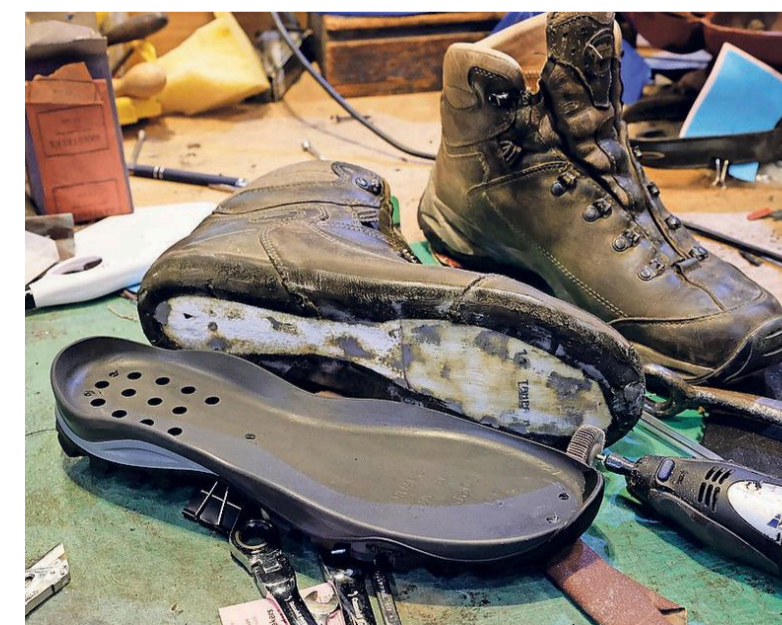
Stukgelopen wandelschoenen, niet wegdoen.

een nieuwe te kopen. Die duurzaamheidsgedachte vind ik nog weinig terug op het gebied van kleding en schoenen. Natuurlijk, als ik meer klanten krijg, profiteer ik daarvan, maar de verspilling die nu vaak nog plaatsvindt, gaat me echt aan het hart. Er valt op dat terrein nog wel wat te winnen.”